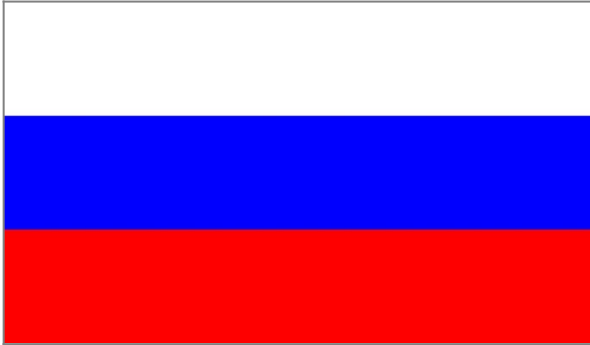
Государственный флаг РФ